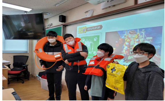
선박탈출넘버원 구명장비 체험