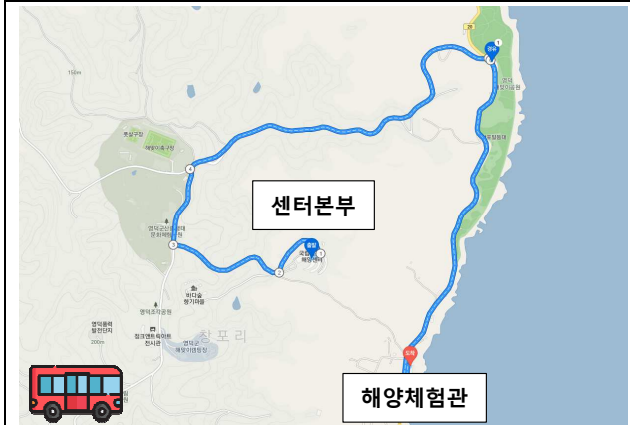
<차량 이동 시, 약 15분 소요(4.2km)>

1. 센터본부와 체험관은 이원화되어 있습니다. 이용 시 참고 부탁드립니다.